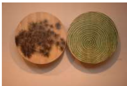
Сл.5 Изложба State of mind , 2008