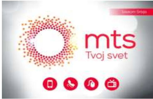
Сл.1 Редизајниран лого компаније Телеком