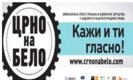
Сл.бр.4 Плакат кампање Црно на бело (дизајн Иво Матејин)

Визуелна симболика знака илуструје назив кампање, која даље упућује на слогане Кажи и ти гласно и Заједно смо јачи . У овом примеру „задатак“ круга није примарно везана за архетипска значења, већ је замисао била да упечатљивост знака и симболика зупчаника остварује јако енергетско и мотивационо дејство на посматрача.