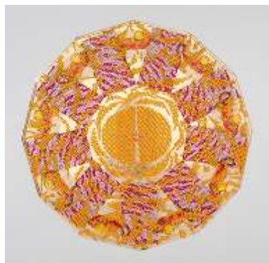
Сл.7 Из циклуса Моје Сунце , 2011.